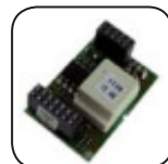
RS485 Schnittstelle 485PB-NR