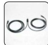
SMA Power Balancer Y Kabel PBL-YCABLE-10